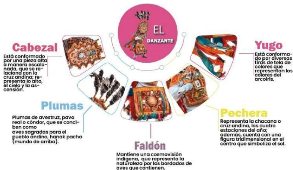
Figura 4. Infografía descriptiva sobre los elementos destacados dentro de la vestimenta del personaje el Danzante.

Nota: Descripción general de los personajes del Corpus Christi.