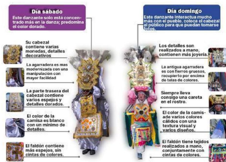
Figura 6. Infografía comparativa de las diferencias visuales entre los trajes del Danzante del sábado y domingo.

Nota. Infografía descriptiva detallada minuciosamente de la vestimenta del personaje del Corpus Christi.