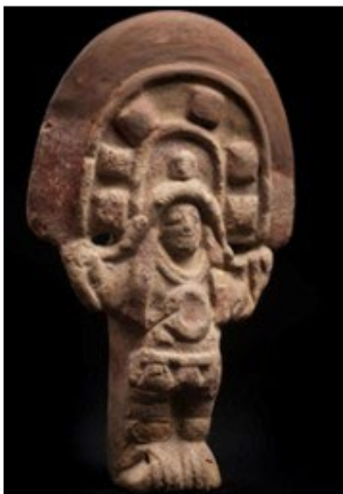
Figura 1. El Danzante personaje central de la celebración del “Corpus Christi”.

Nota: (Danzante, Cultura Jama Coaque 350 a.c – 1533 d.c.).