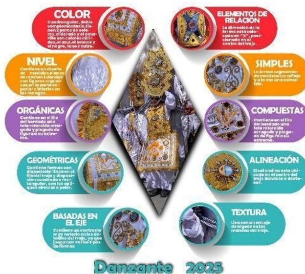
Figura 5. Infografía descriptiva basada del estudio visual en el vestuario de los personajes.

Nota: Infografía descriptiva detallada minuciosamente de la vestimenta del personaje del Corpus Christi.