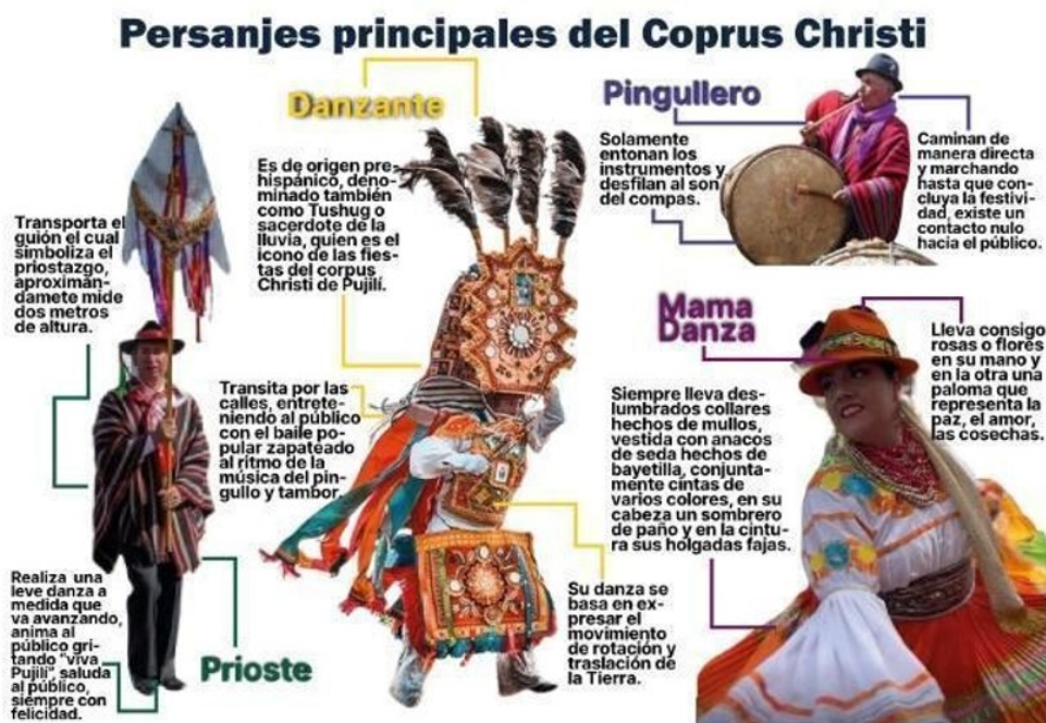
Figura 3. Infografía sobre la descripción general de acciones y vestimentas acerca de los cuatro personajes principales del Corpus Christi.

Nota: descripción general de los personajes del Corpus Christi.