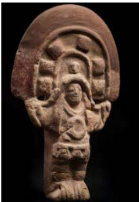
Figura 1. El Danzante personaje central de la celebración del “Corpus Christi”.

Nota: (Danzante, Cultura Jama Coaque 350 a.c – 1533 d.c.).