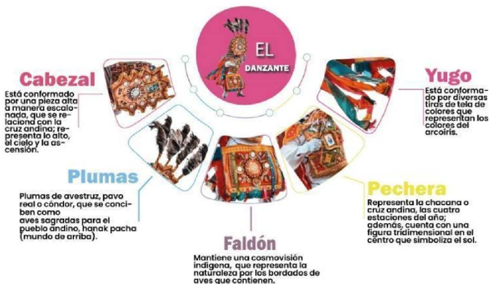
Figura 4. Infografía descriptiva sobre los elementos destacados dentro de la vestimenta del personaje el Danzante.

Nota: Descripción general de los personajes del Corpus Christi.