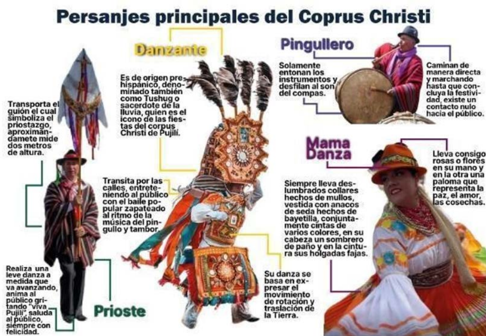
Figura 3. Infografía sobre la descripción general de acciones y vestimentas acerca de los cuatro personajes principales del Corpus Christi.

Nota: descripción general de los personajes del Corpus Christi.